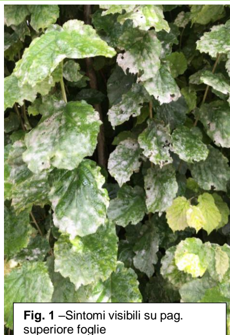
Fig. 1 – Sintomi visibili su pag. superiore foglie

In questa fase è molto importante che vengano segnalate tutte le situazioni sospette per poter identificare il fungo e adottare la miglior strategia di contenimento alla diffusione.