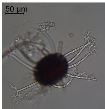
Fig. 3- Corpo fruttifero con appendici ramificate