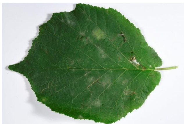
Fig.2- Foglia con feltro micelico su pag. superiore