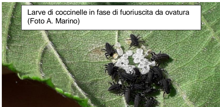
Larve di coccinelle in fase di fuoriuscita da ovatura

Sono giunte anche segnalazioni di noccioleti con infestazioni di afidi che con la loro melata rendono traslucide ed appiccicose le foglie.