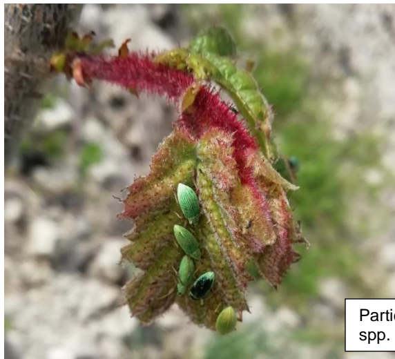
Particolare di germoglio attaccato da adulti di Polydrusus spp.

Il curculionide può in caso di gravi attacchi soprattutto in impianti giovani provocare defogliazioni consistenti. Si consiglia di contattare il tecnico nel caso la superficie fogliare sia compromessa (50% di attacco) di contattare il tecnico per decidere insieme la strategia da valutare.